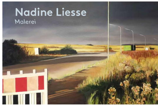
Nadine Liesse Malerei