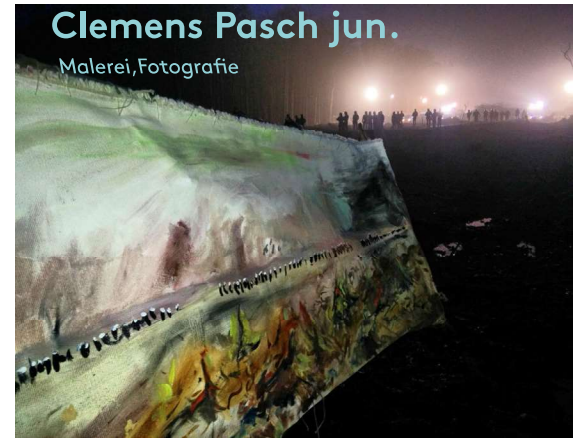
Clemens Pasch jun. Malerei, Fotografie