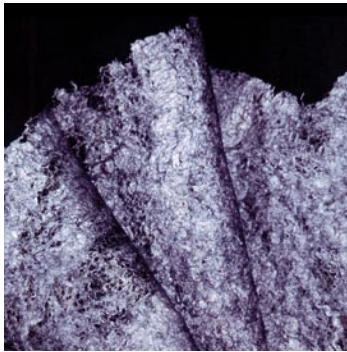
01 Midnight Meditation / 2007

In der Ausstellung dialog filz. objekte und installationen werden die künstlerischen Ausdrucksmöglichkeiten von Filz in ihren unterschiedlichen materiellen Eigenschaften untersucht. Im Dialog der fünf beteiligten, international bekannten Künstlerinnen entstehen räumliche und geistige Verbindungen, die mit der Spiritualität der jahrhundertealten Klosterräume korrespondieren. Eine Verwandlung durch Anverwandlung.