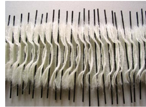
03 endlos.endlich / 2006–2007