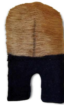
02 Kaschmirwollfilz / 2001