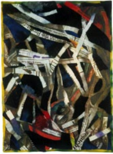
04 Papierschnipsel / 2003